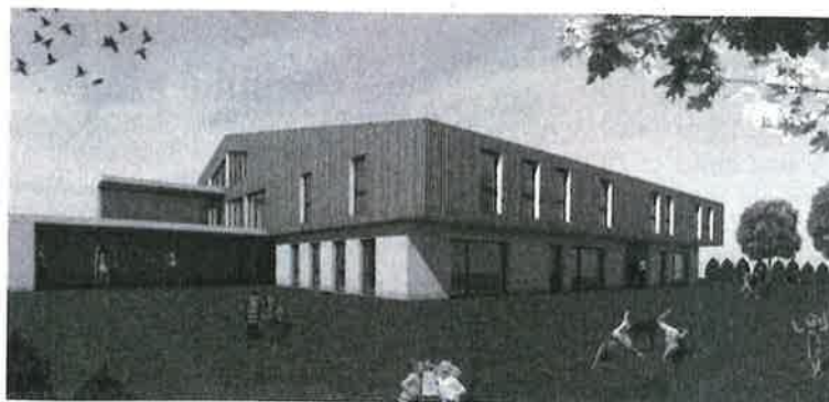
Le projet de la maison de l'enfance à Reconvilier fera l'objet d'une présentation détaillée le 14 mars à la Salle des fêtes.

Le Conseil municipal de Reconvilier convie la population à une présentation publique du projet de la maison de l'enfance le lundi 14 mars à la Salle des fêtes.