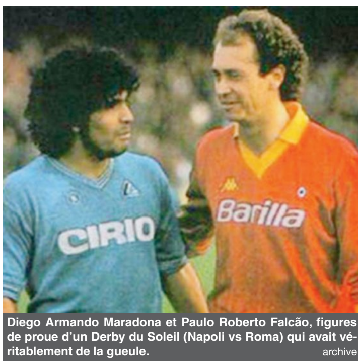
Diego Armando Maradona et Paulo Roberto Falcão, figures de proue d'un Derby du Soleil (Napoli vs Roma) qui avait véritablement de la gueule.

Sur un terrain, l'Argentin mettait néanmoins tout le monde d'accord. Difficile à bouger malgré sa petite taille, il était muni d'une intelligence de jeu très largement au-dessus de la moyenne et d'un sens de l'anticipation qui lui permettait d'avoir constamment un temps d'avance sur ses adversaires. Surtout, il possédait un