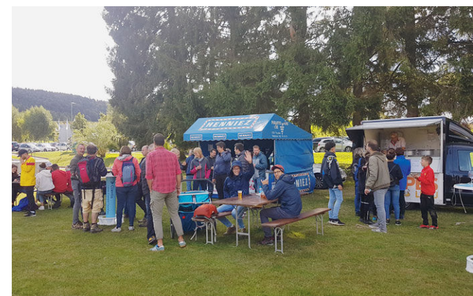
Une pause arrosée bien méritée à l'arrivée au stade de Tramelan.