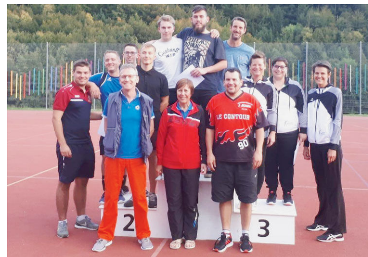
Les gagnants du tournoi de volley avec les organisateurs devant le podium.