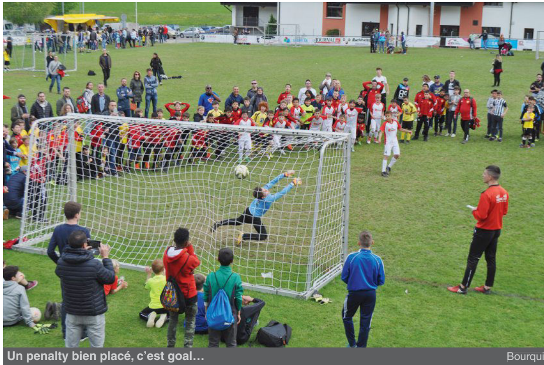
Un penalty bien placé, c'est goal...

Plus de 130 matches d'une durée de 12 à 18 minutes, selon la catégorie, se sont disputés sur la pelouse de les Lovières. Comme l'a relevé le responsable, Francesco Martello «Tout s'est bien passé dans une ambiance chaleureuse et empreinte d'un fair-play exemplaire. Le niveau de jeu était de bonne qualité, même déjà chez les plus jeunes des caté-