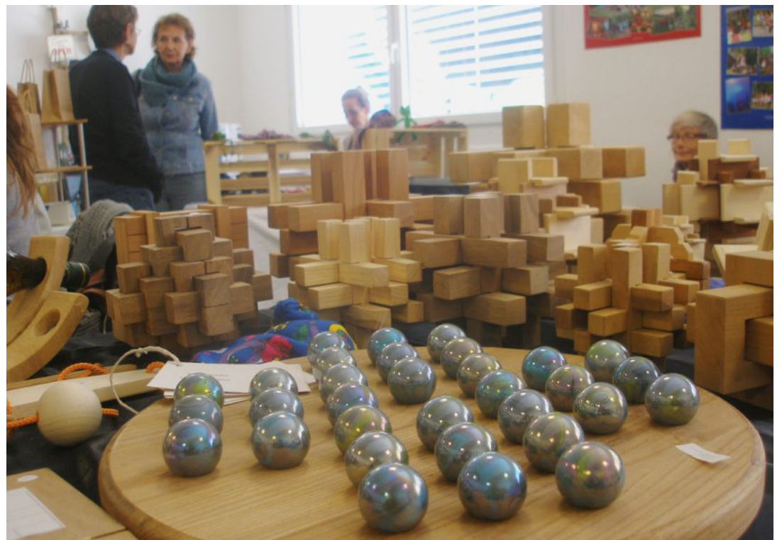
Jeux de bois, produits du terroir et autres fantaisies, de quoi satisfaire toutes les envies.

Jeux en bois, bijoux, tricots ou feutrages de laine, aquarelles, peintures et pastels, cartes, bougies ou objets de décoration. Sur les étales, le petit plaisir personnel ou le sympathique cadeau annonciateur de Noël pouvait, sans ombrage,