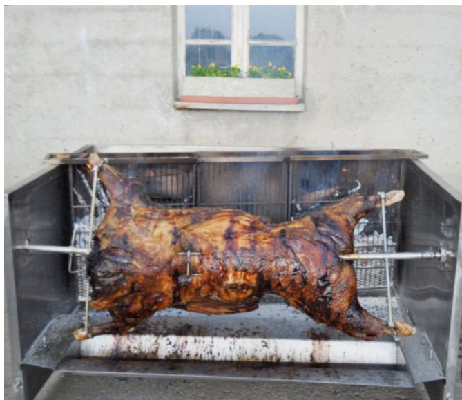
Première gastronomique originale à l'Orange gourmande: le sanglier à la broche. MICHEL BOURQUI