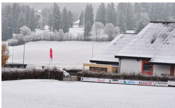
La haie entre le terrain de football et la patinoire ne sera bientôt plus qu'un souvenir. MICHEL BOURQUI

Plantée à la fin des années 1980 après la construction de la patinoire, la haie qui borde le terrain de football côté Sud, le long du chemin d'accès à la patinoire et à la Marelle, ainsi que celle du côté Est, vont être arrachées ces prochains jours. Il en ira de même pour celle située à l'ouest du terrain d'entraînement. Autant dire que l'aspect visuel va radicalement changer du côté de la Place des sports des Lovières.