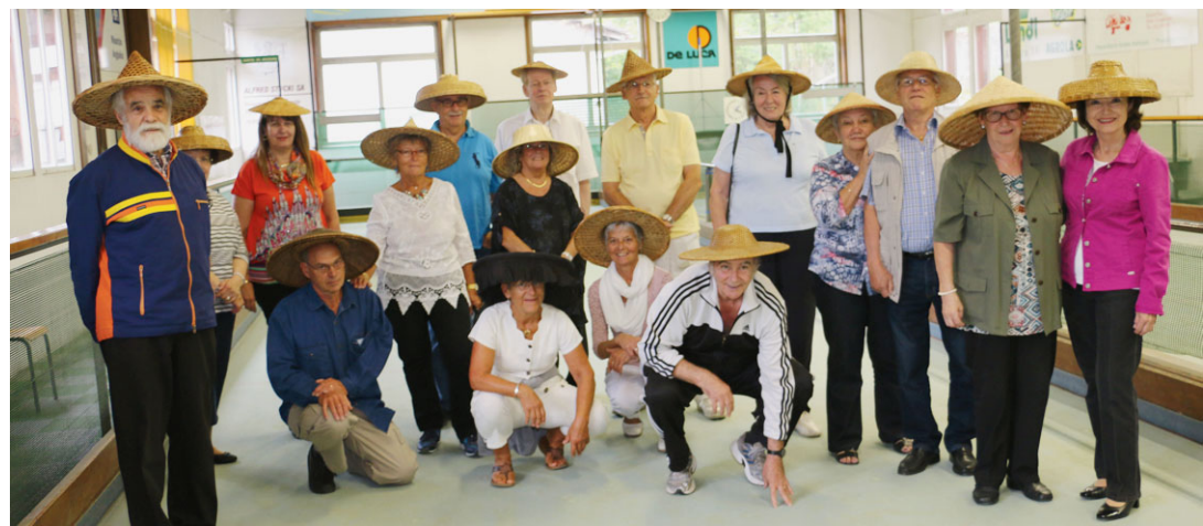
Une partie de boules au boulodrome de Corgémont avant de passer à table.