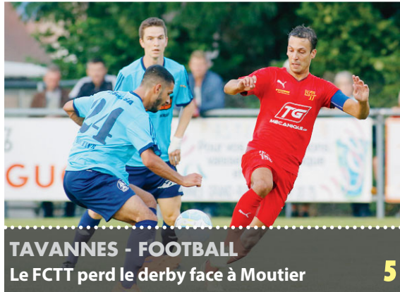
TAVANNES - FOOTBALL Le FCTT perd le derby face à Moutier 5