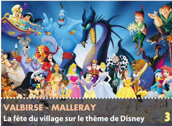
VALBIERSE - MALLERAY La fête du village sur le thème de Disney 3