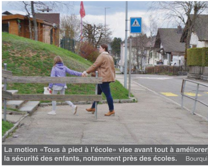
La motion «Tous à pied à l'école» vise avant tout à améliorer la sécurité des enfants, notamment près des écoles. Bourqui

Les travaux sont planifiés sur trois ans. La première étape aura lieu en 2018 (Dolaises - Ch. Des Combes sur 250 m), la 2e étape (Chemin des Combes - Combe Aubert sur 330 m) en 2019 et la 3e étape (Combe Aubert - Sentier Batanvaux sur 130 m) en 2020. Bien entendu, le remplacement de la conduite d'eau potable engendrera des travaux d'adaptation et renouvellement des autres réseaux communaux (routes, éclairage public, électricité et évacuation des eaux usées, aménagement du carrefour Combe-Aubert avec un nouveau passage pour piétons).