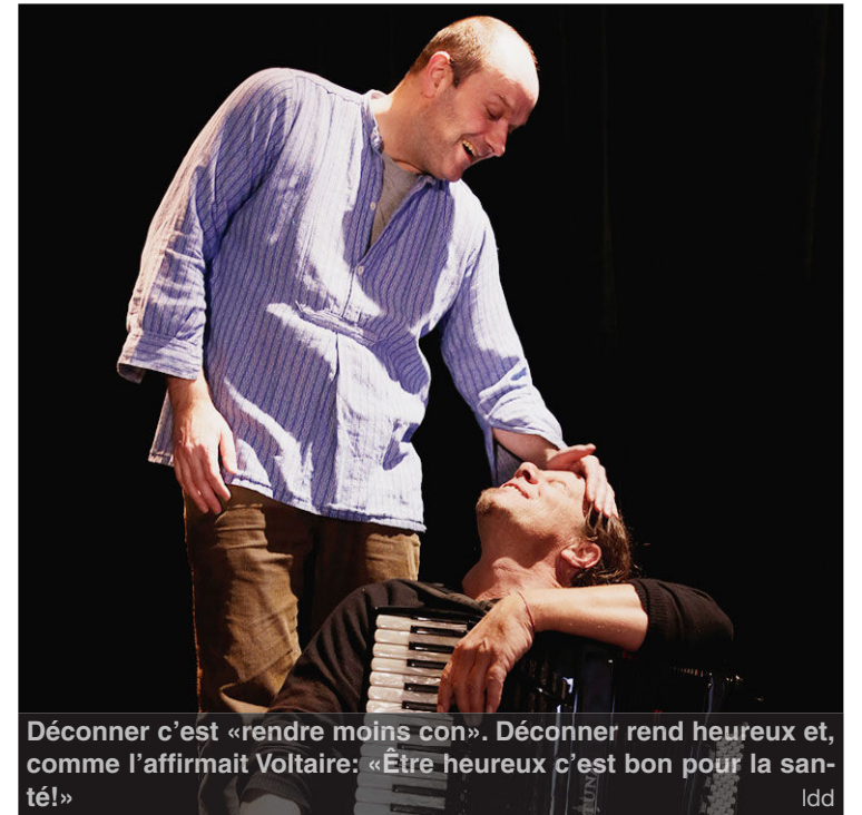
Déconner c'est «rendre moins con». Déconner rend heureux et, comme l'affirmait Voltaire: «Être heureux c'est bon pour la santé!» Idd

► Massacre à la déconneuse, dimanche 30 octobre, à 17h, au CIP. Renseignements: 032 486 06 06.