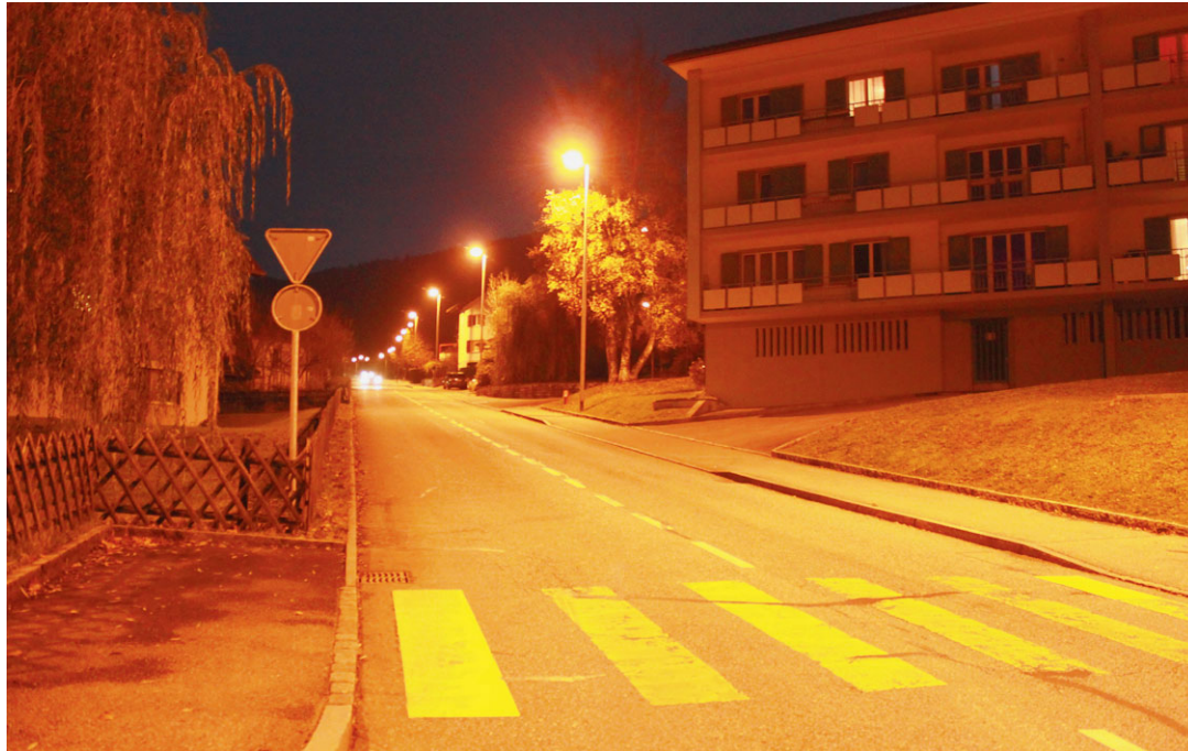
Le PDC souhaite que la cité prévôtoise réduise son éclairage public. Selon lui, une diminution de la luminosité dans le secteur de Chantemerle serait notamment envisageable. CATHERINE BÜRKI

De l'avis du PDC, l'intensité lumineuse pourrait ainsi être revue à la baisse en plusieurs secteurs de la commune. Et ceci à commencer par les zones résidentielles, notamment dans le quartier de Graiteray ou du côté