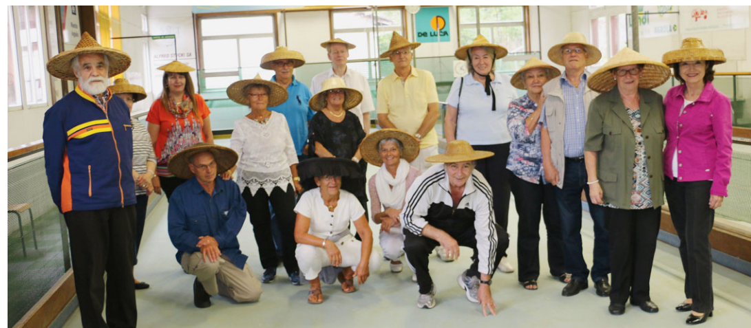
Une partie de boules au boulodrome de Corgémont avant de passer à table.