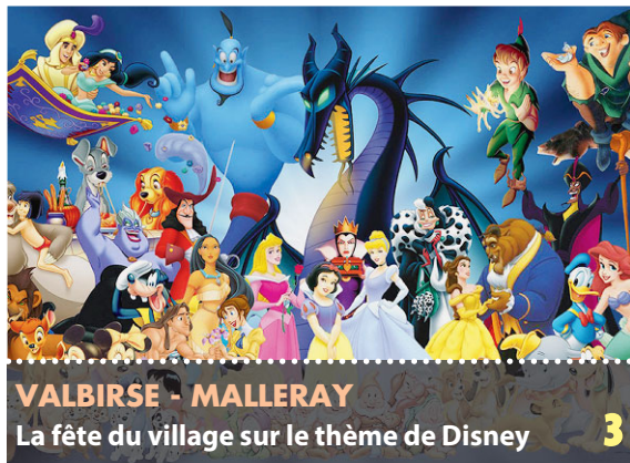
VALBIERSE - MALLERAY La fête du village sur le thème de Disney 3