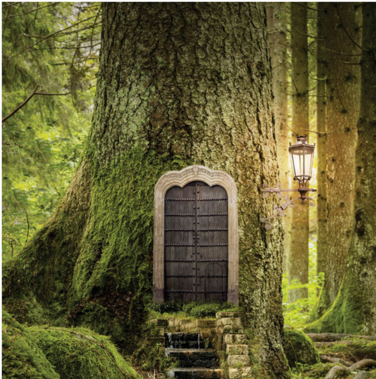
Pendant quatre soirées, les participants entreront dans le monde des contes et seront amenés à créer un spectacle collectif qui sera donné en public lors d'une 5e soirée. ldd